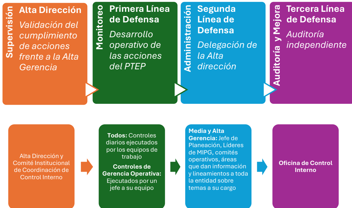
Ilustración 2. Roles y Líneas de Defensa - Programa de Transparencia y Ética Pública 2025-2027