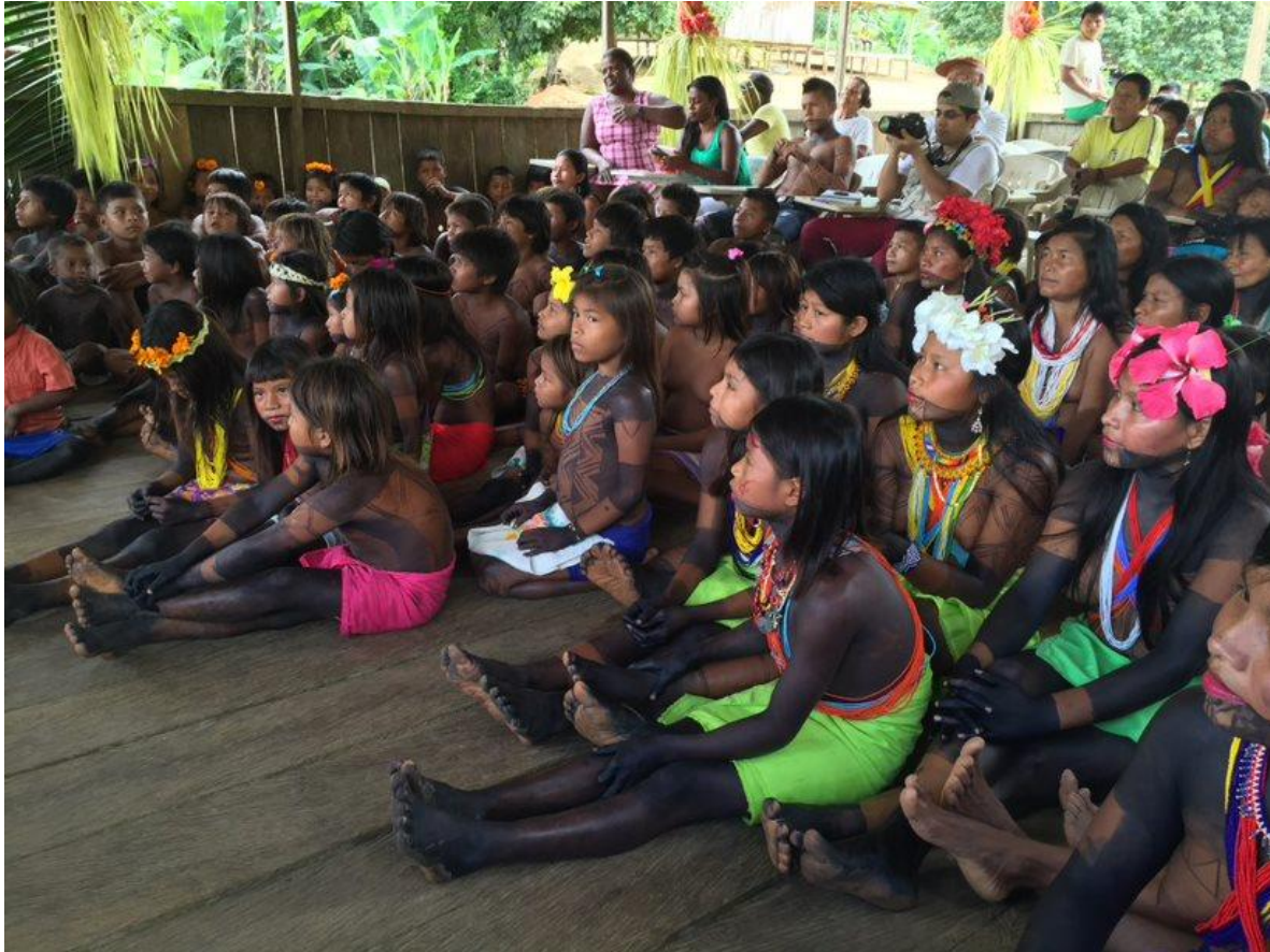
Comunidad El Yucal.